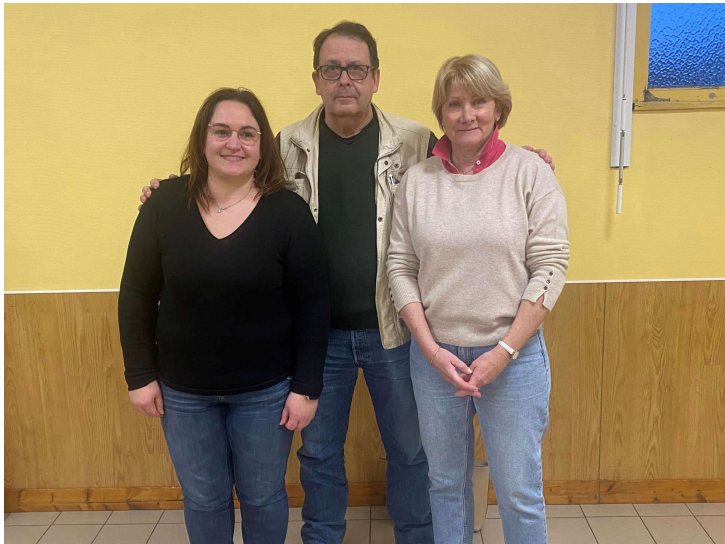
Nos deux équipes qualifiées